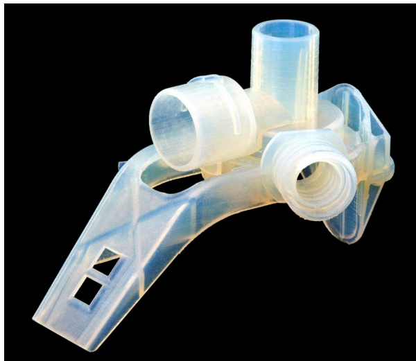
Prototyp eines Pumpengehäuses mit eingebautem Druckventil, entwickelt für Maytag-Waschmaschinen. Prototyp, hergestellt von AMRCC aus dem DSM Somos® ProtoFunctional® Harz. Dieses Teil war robust genug, um in die Waschmaschine eingebaut und getestet zu werden. So konnten Änderungen vorgenommen werden, bevor die Spezifikationen für das serienreife Produkt endgültig festgelegt wurden.

Maytag Corporation betreibt die SLA-5000 Stereolithographie-Anlage des Konsortiums. Im Oktober 2000 stellte Maytag das Stereolithographie-Harz, das in der SLA-5000-Anlage zum Einsatz kommt, auf Somos® 9120 um. Kevin Shipley, AMRCC SLA, erläutert, dass AMRCC mit der Leistungsfähigkeit des 9120 Harzes äußerst zufrieden ist. "Unsere Kunden sind hochofrend", erklärte er. Tatsächlich hat sich der Umsatz mehr als verdreifacht, seit Somos® 9120 angeboten wird.