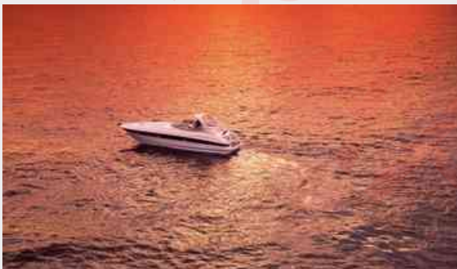
Yachts di Bavaria

contro l'osmosi. La resistenza dei laminati nell'area della chiglia viene consolidata dalla sovrapposizione di tutti i mat e roving. Sopra la linea di galleggiamento e nel ponte, viene utilizzato un laminato a sandwich con anima in polistirolo e PVC, legata con una speciale pasta collante leggera. L'idoneità di questa costruzione viene confermata da agenzie di certificazione indipendenti. Oltre ai mat in fibre di vetro viene utilizzato anche tessuto multiassiale e tessuto in aramide per migliorare la resistenza all'impatto in aree specifiche. (Continua a pag 2)