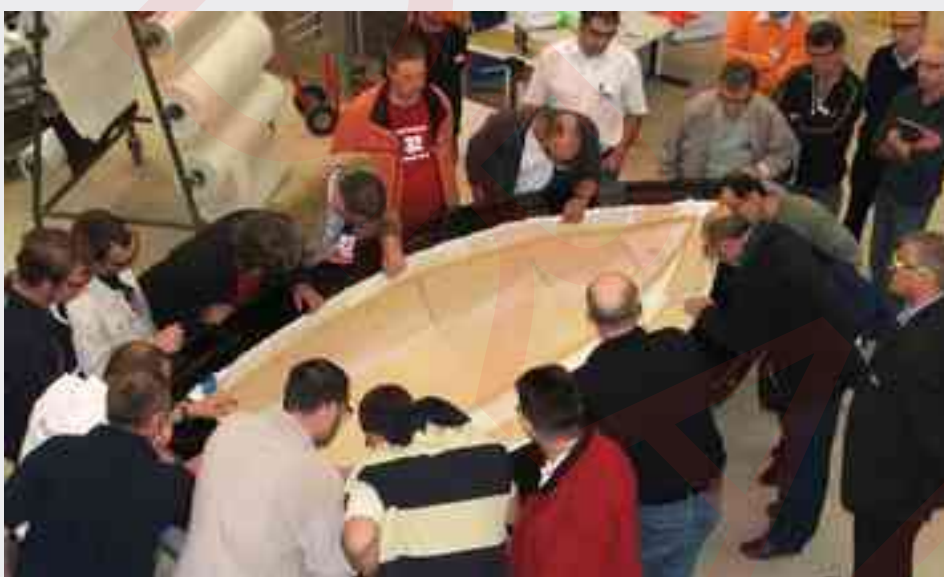
Discussione del processo di infusione sottovuoto

I costruttori nautici che investono il proprio tempo in incontri di questo tipo, si aspettano un ritorno sugli investimenti. Gli incontri Marine Days di DSM sono stati pianificati proprio per fornire la massima quantità possibile di informazioni preziose. Nel corso dei due giorni vengono illustrate le best practice per ottenere stampi e parti stampate ottimali.