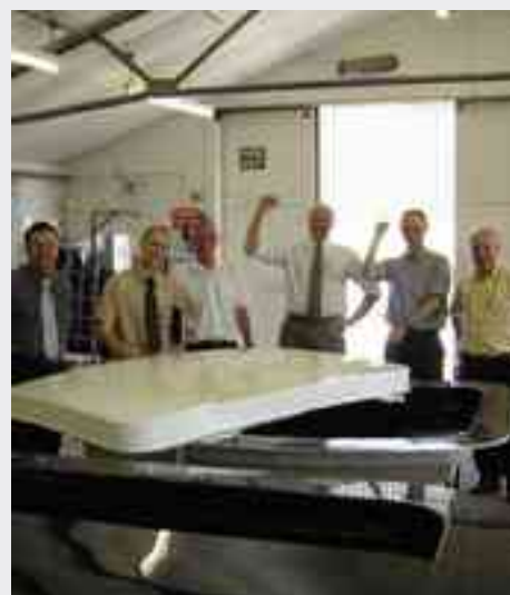
Il team responsabile per l'infusione ad Aquafibre