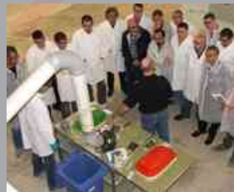
Lavoro pratico con Neomould

Si tratta di un programma impegnativo, ma il feedback dei partecipanti è stato molto positivo (si veda pagina 1). Per partecipare a uno dei workshop pianificati per il 2007, vi invitiamo a contattare il rappresentante delle vendite DSM/Euroresins locale.