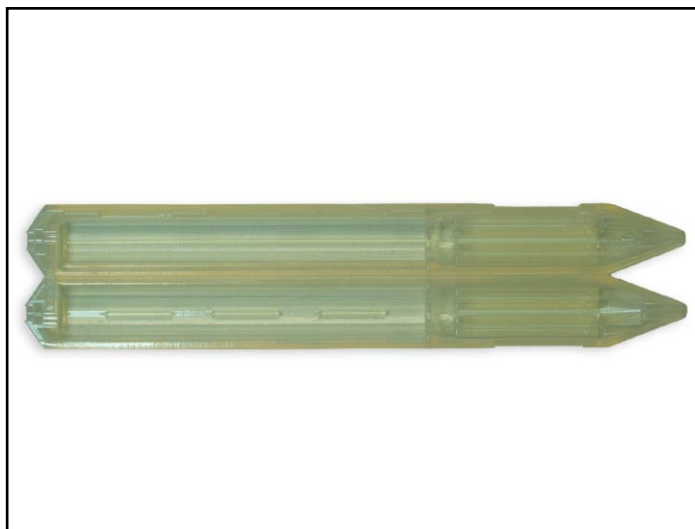
Pour réduire les coûts à travers une conception améliorée, IPPD a créé un concept en coquille pour le corps du stimulateur, réalisé ici dans la résine SL DSM Somos® 8120.