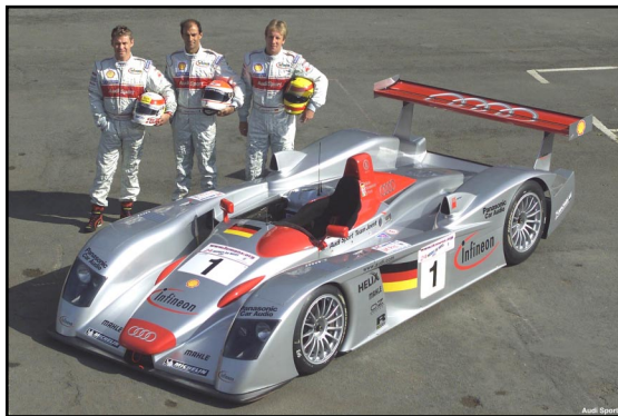
Il team Joest di Audi Sport.