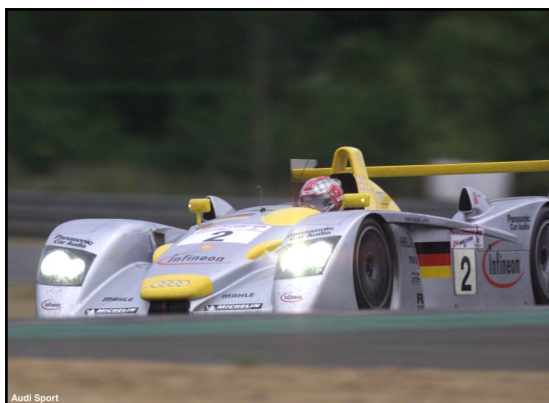
Audi Sport Pilota di Audi, Rinaldo Capello (#2), nella seconda qualifica (Le Mans 2001).

Elemento fondamentale del progetto è la struttura posteriore delle vetture che può essere rimossa e rimpiazzata interamente. Se dovesse presentarsi questa necessità, tale soluzione permette all'Audi Sport di ridurre al minimo i tempi del pit-stop. La gara Le Mans è una lunga corsa di 24 ore e il detto dell'industria afferma che si può vincere o perdere questa rigorosa gara nei box. Grazie a questa soluzione innovativa, Audi è stata in grado di completare un pit-stop per rifornimento, cambio pneumatici e sostituzione della struttura posteriore in soli 5 minuti e 22 secondi. Prima dell'arrivo di Audi a Le Mans, 30 minuti per un pit-stop erano considerati un tempo 'eccellente'.